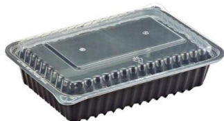
COMBO PACKED 可回收PP底盒 + 透明上蓋

VG微波硬式餐盒採用高硬度PP製作，符合食品器具、容器、包裝衛生材質試驗標準。耐熱溫度自-20°C至120°C，既可冷藏與亦可微波使用。具耐油特性，可用洗碗機清潔，堅固可重複使用。適合高級餐廳外燴，或自家製作料理致贈親朋好友用。